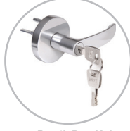
Panik Bar Kolu Panic Device Handle KD040/30-291