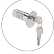
Panik Bar Bareli Panic Device Cylinder 164YN00001